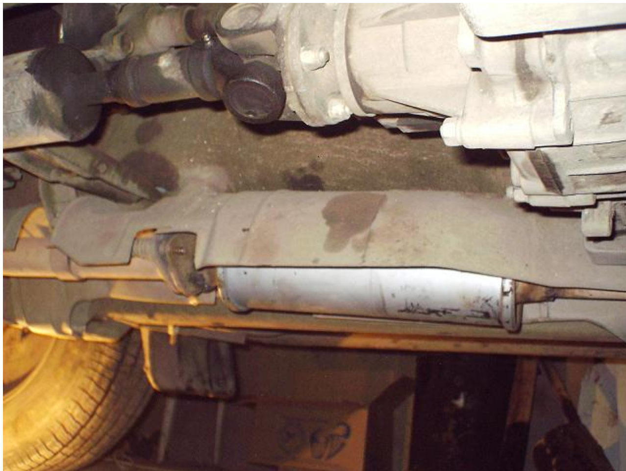
Рисунок 4 - Вид сбоку