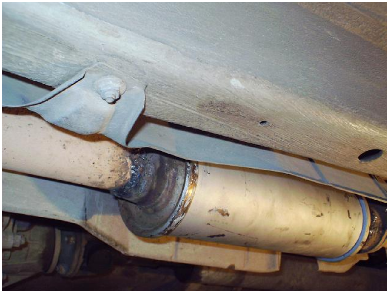
Рисунок 3 - Вид сзади